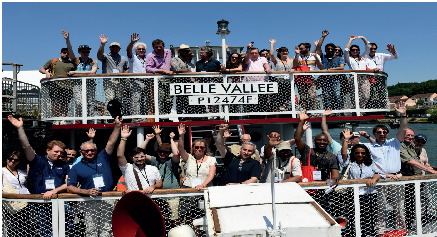
@ Mario-Henrique Hiranda

« VIVRE LA SEINE AU QUOTIDIEN. EMERGENCE D'UNE VILLE COMPLÈTE AU SUD DE LA MÉTROPOLE PARISIENNE » 5 - 8 juillet 2019