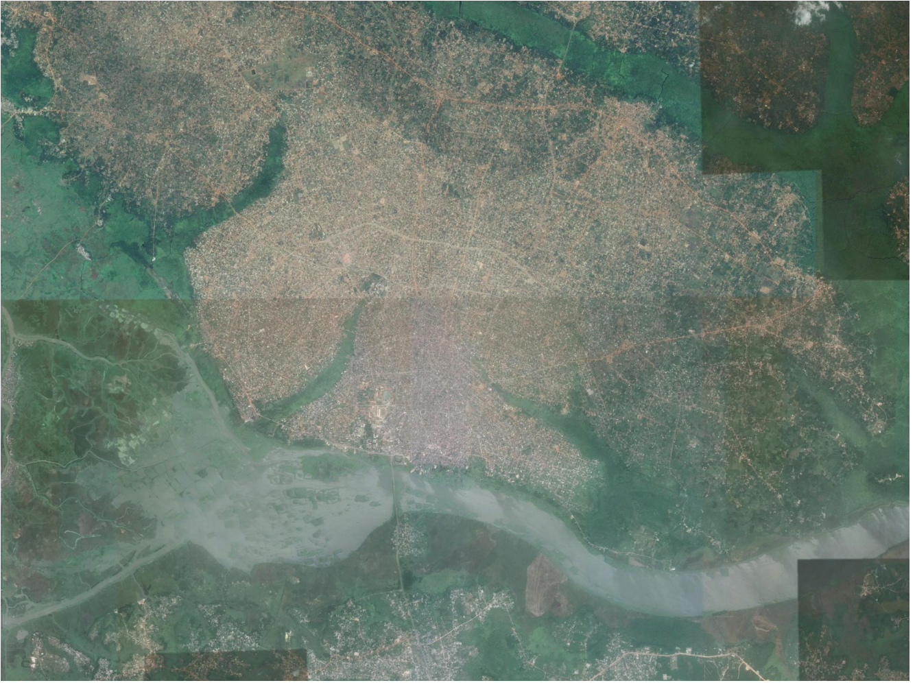
Vue satellite de Porto-Novo