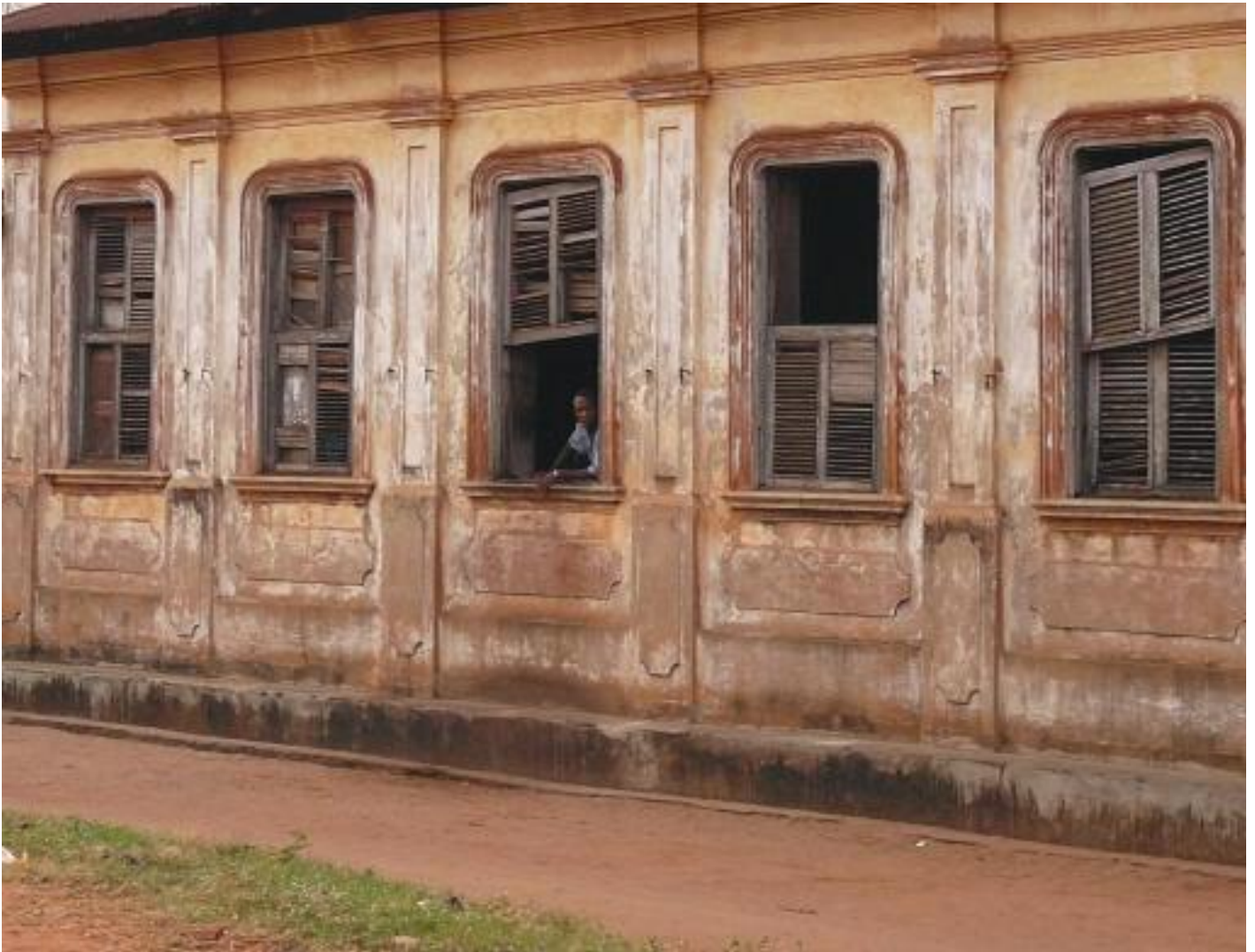
Le patrimoine architectural Afro-brésilien, la maison Godonou-Dossou