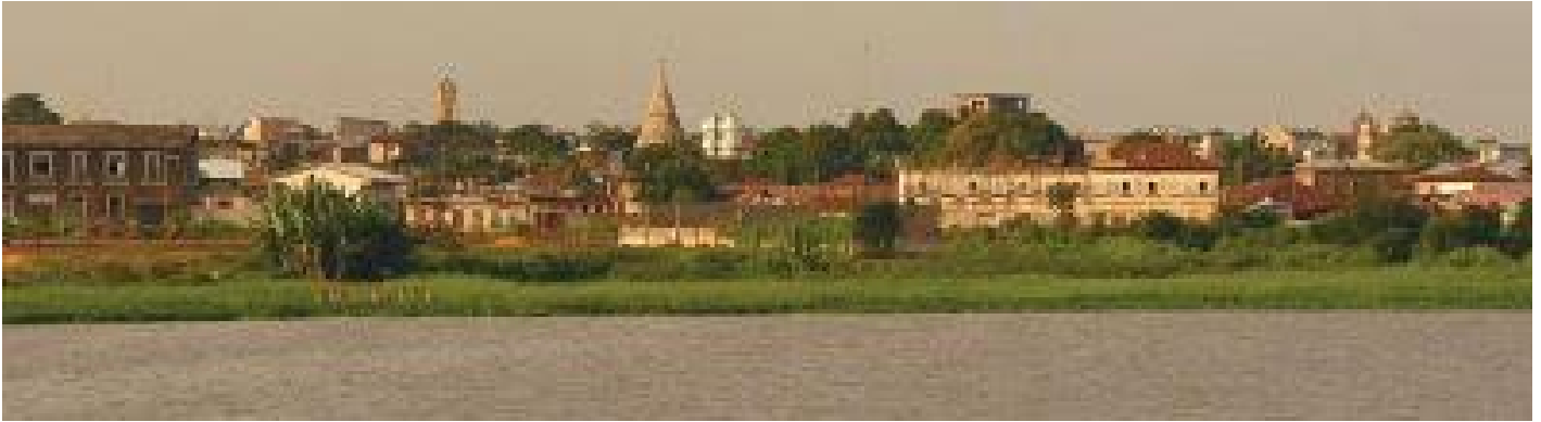
Vue sur le coeur de ville de Porto-Novo depuis les berges de la Lagune