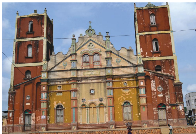
Architecture afro-brésilienne, la grande Mosquée de Porto-Novo

L'ensemble de ce patrimoine a fait l'objet d'un inventaire sur un financement de la banque mondiale en 2001 par l'Ecole du Patrimoine Africain (EPA) en association avec l'Ecole Africaine d'Architecture et d'Urbanisme de Lomé (EAMAU). Plus de 597 éléments ont été répertoriés dont certains suscitent une démarche d'inscription sur le patrimoine mondial de l'Unesco au regard de leur importance exceptionnelle.