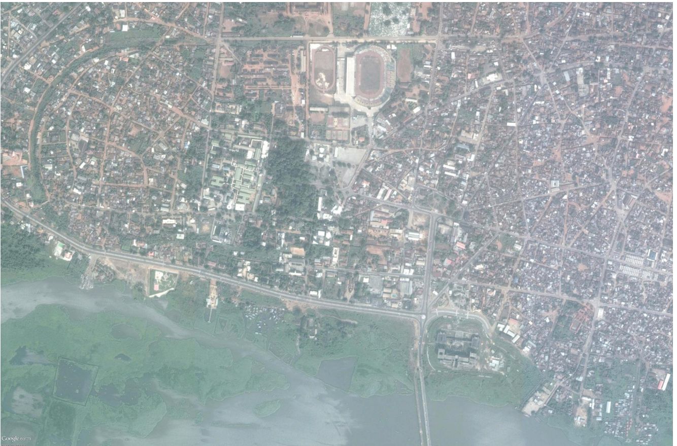
Vue satellite du centre ville de Porto-Novo