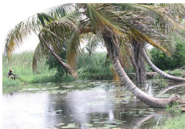
Les berges de la Lagune