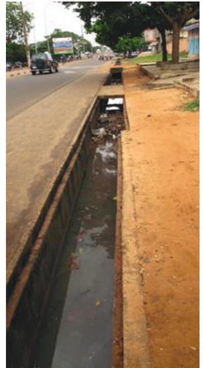
Cas d'inondations dans la ville de Porto-Novo