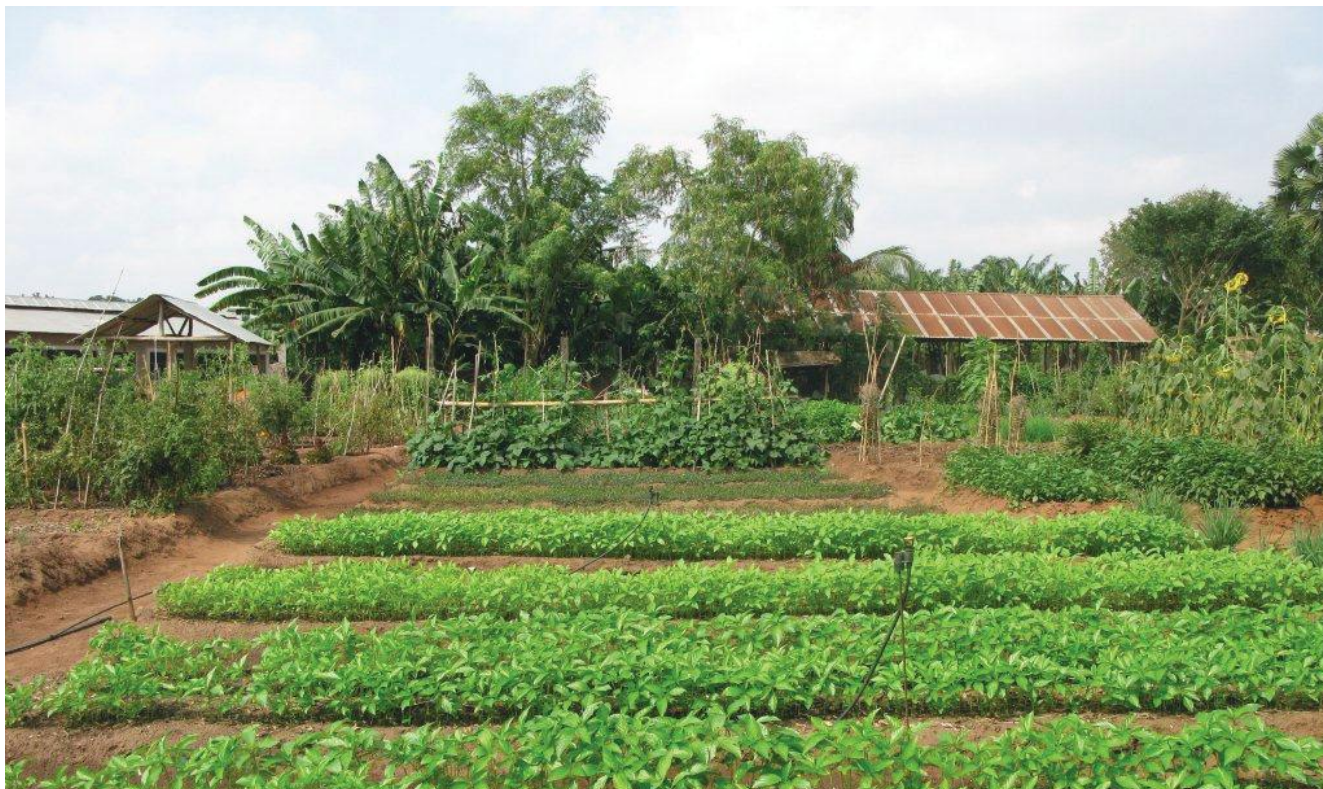
Maraichage le long des Berges