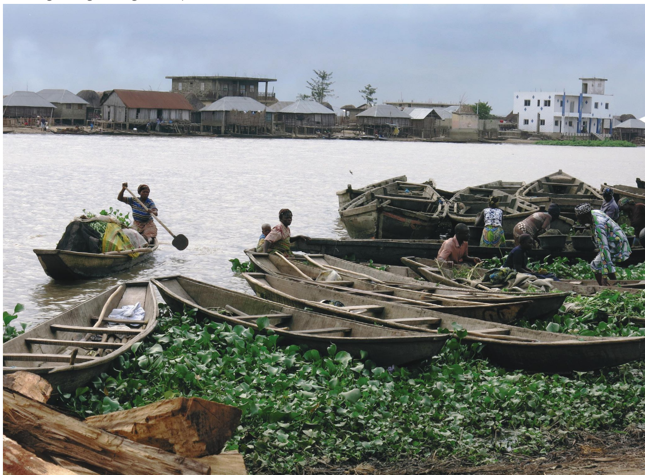
Les berges de la Lagune