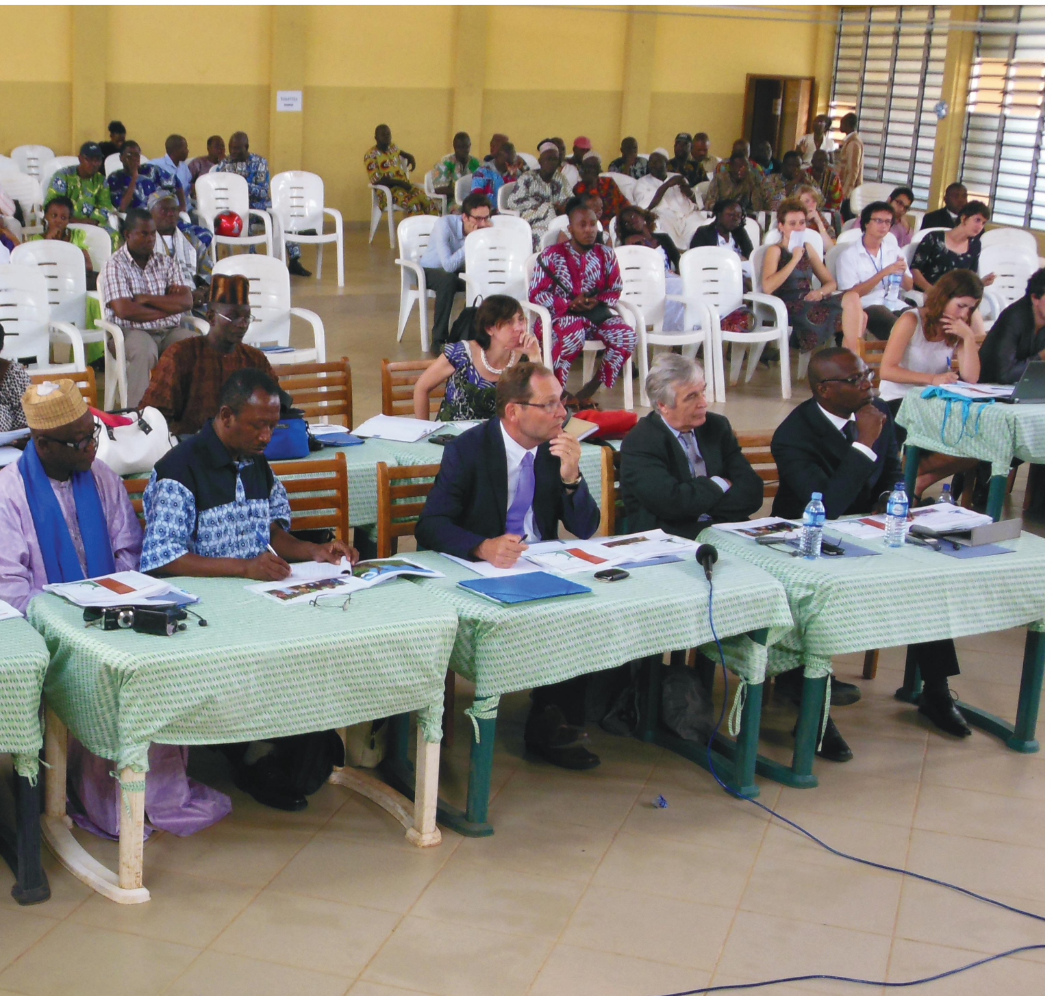
LES ATELIERS EN ACTION Jury d'une session des Ateliers Ouest Africains à Porto-Novo