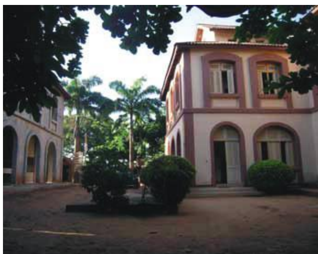
Le patrimoine de l'architecture coloniale, l'école du patrimoine africain.