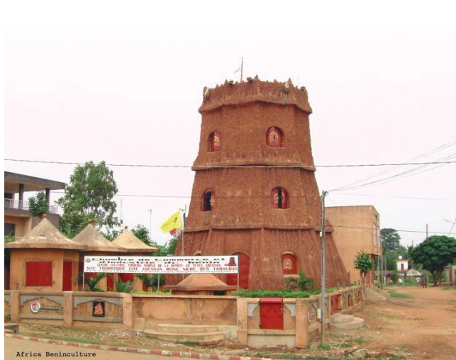
Le temple Abessan, aujourd'hui centre culture Yoruba de Porto-Novo