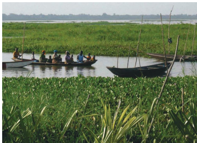
Zone humide du Lac Nokoué

La ville se distingue également par son jardin des plantes et de la nature, vestige d'une ancienne forêt sacrée, qui est un héritage précieux situé dans la zone administrative coloniale.