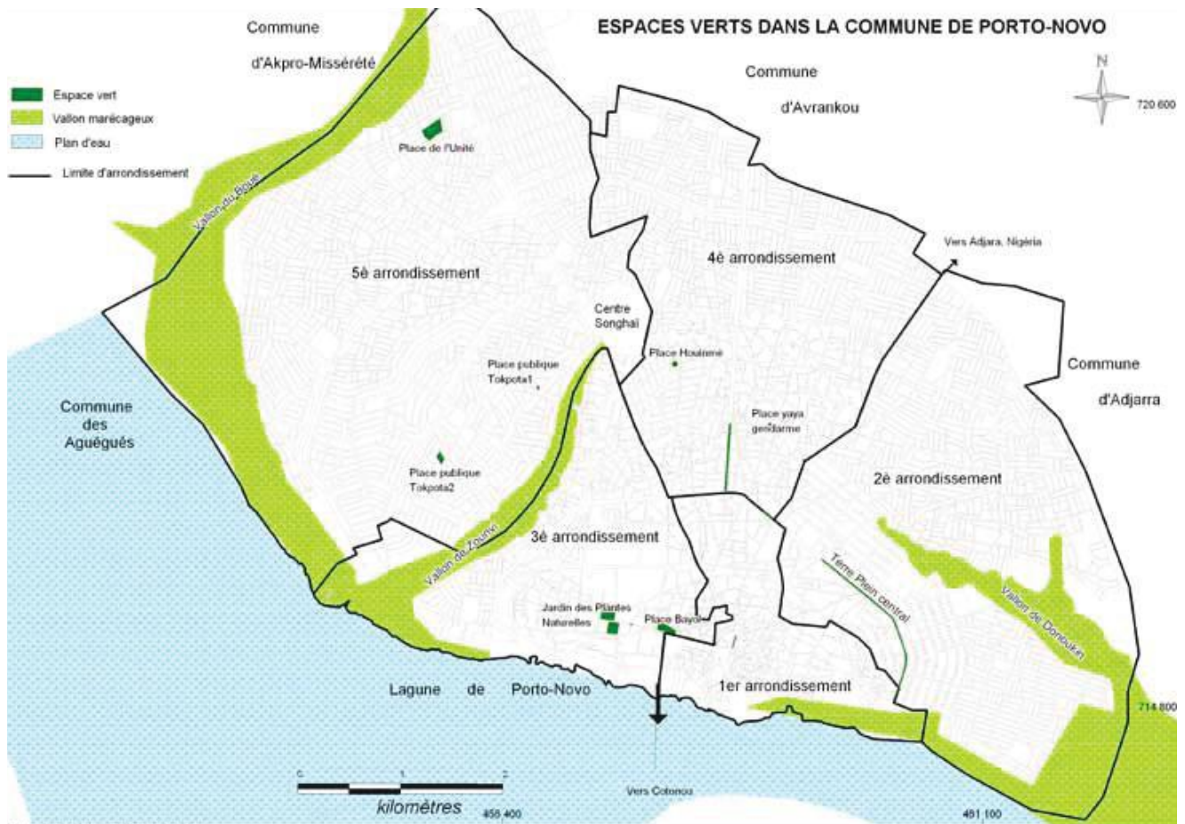
Carte des espaces verts de Porto-Novo