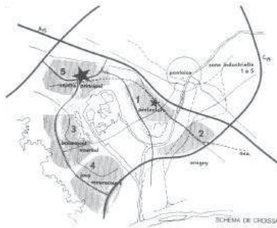
Plan original de la Ville Nouvelle

Six équipes pluri-disciplinaires se sont attelées à la tâche, en proposant souvent des idées similaires, que nous avons ici reprises.