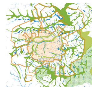
Concept de ceinture verte