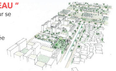
Un continuum vert et bleu dans toute la ville

■ Densifier pour mieux se loger, de la cour familiale aux espaces partagés