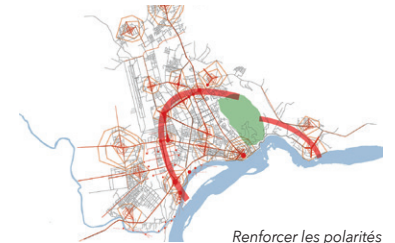
Renforcer les polarités

■ Il apparaît nécessaire pour renforcer la multipolarité de la ville de Bangui de casser son caractère bipolaire afin de mieux répartir les activités, et de favoriser l'émergence de plusieurs centralités situées dans une aire relativement restreinte de 5km x 5km. L'équipe propose également de bien connecter ces quartiers entre eux au travers d'un transport en commun en site propre, afin de bien faire fonctionner les complémentarités données par leurs positions géographiques.